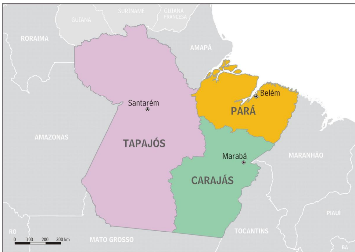
Figura 1 - Estados do Pará, Carajás e Tapajós, conforme propostas PDC 2300/2009 e PDC 731/2000 (elaboração do autor; bases cartográficas CEM/Cebrap originárias de arquivos IBGE) 2

Estes projetos, que substituem versões similares apresentadas anteriormente, fazem-se acompanhar de diversos outros, apresentados desde a década de 1990.